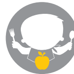
Μετά τον απογαλακτισμό