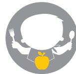
Μετά τον απογαλακτισμό